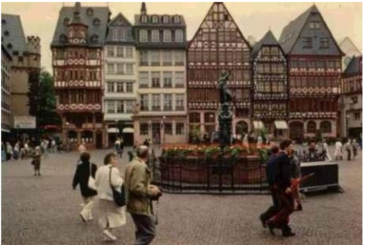
Cidade alemã na época de Hahnemann

Certa vez me perguntaram se havia também a possibilidade de ocorrer o mesmo com a Acupuntura, ou seja, supressão, agravação, enfim, as leis de cura tal como ocorre com a homeopatia e creio que com qualquer terapêutica energética, sim.