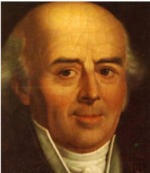
Christian Friedrich Samuel Hahnemann (Meissen, Saxônia, 10 de Abril de 1755 - Paris, 2 de julho de 1843) foi o fundador da homeopatia em 1779.

Durante um episódio de doença aguda, se houver febre, diarreia, vômitos, qualquer sintoma ou sinal, aplique sempre as alternativas abaixo, comparando com o estado normal do paciente.